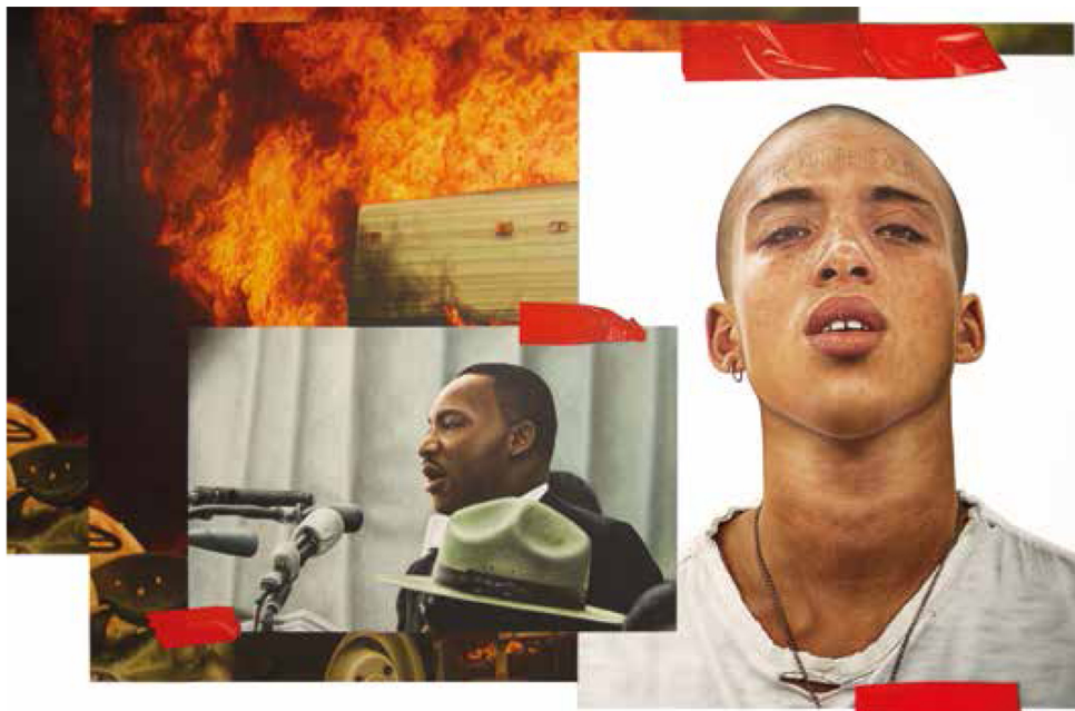
The Future Is Old. THE KID, 2018-2019. MOCO Museum, Amsterdam. Oil painting on canvas. 244 x 351 x 6 cm.

'Ja, ik denk dat dit is wat al mijn werken gemeen hebben, ondanks hun leeftijd en schoonheid. Ik probeer ze vast te leggen in hun bepalende moment, voor altijd gevan-